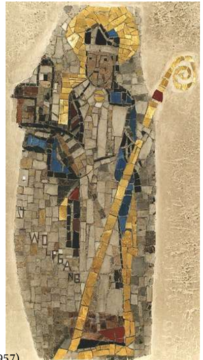
Pfarrkirche St. Wolfgang, Landshut: Mosaik des hl. Wolfgang (Franz Nagel, 1957)

19:00 Löwendorf: Eucharistiefeier zum Patrozinium